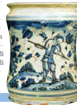
Museo della Ceramica: albarello, ovvero vaso di farmacia

Gli influssi partenopei. La ricostruzione portò a Cerreto maestranze napoletane, attratte anche dall'esenzione dalle tasse. La sessuofobica cultura della Spagna dell'Inquisizione, sempre più presente nella spagnoleggiante società partenopea, favorì la diffusione di uno stile compendiario, cioè con sobrie ed essenziali decorazioni tipiche della ceramica di Faenza. Una ceramica popolare nei decori nei quali molti ceramisti