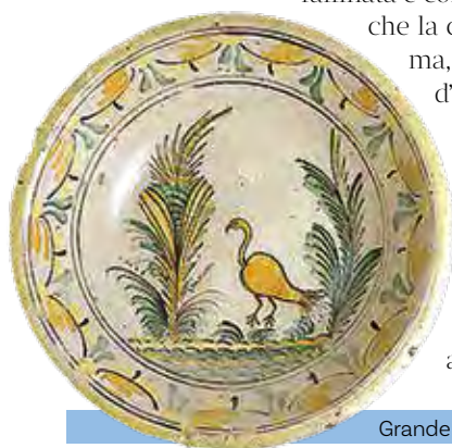
Grande piatto, conservato nel Museo della Ceramica

ma, grazie anche alla istituzione della Scuola d'Arte, oggi Liceo Artistico, le botteghe ceramiche non producono più solo ceramica tradizionale, ma si sono aperte alla ricerca, all'innovazione, al design, inserendosi a pieno titolo nel settore dell'artigianato artistico italiano. Una produzione che spesso e volentieri supera le caratteristiche dell'artigianato puro e semplice per avvicinarsi al mondo dell'arte.