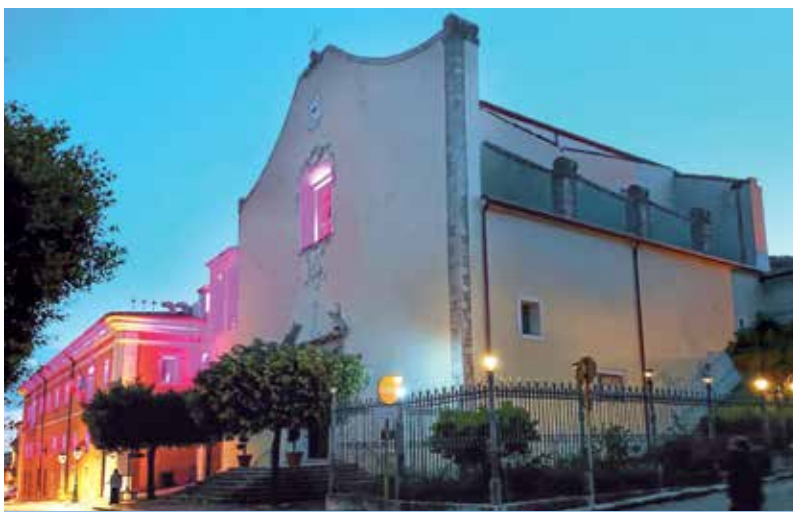
Palazzo S. Antonio, sede dei Musei della Ceramica e di Arte contemporanea

Nell'848 Cominium venne distrutta da un sisma. I superstiti fondarono la seconda Cerreto. Con l'avvento dei Normanni, Cerreto costituì il centro di