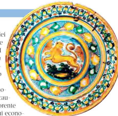
Piatto in maiolica con leone rampante

una signoria assai potente, quella dei Sanframondo. Nel 1483, Diomede Carafa acquistò da re Ferdinando II d'Aragona la terra di Cerreto «... cum casali Sancti Laurenzelli et Civitelle... », ponendo così fine al dominio dei Sanframondo.