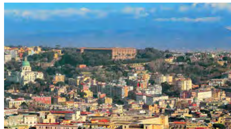
Veduta della verdeggianti collina di Capodimonte, con la grande reggia borbonica

Le porcellane di Capodimonte vedono la luce grazie a un'iniziativa di Carlo III di Borbone che, sposando nel 1738 Maria Amalia Valpurga, figlia dell'elettore di Sassonia Federico Augusto e nipote di Augusto il Forte, creatore della famosa fabbrica di porcellana di Meissen (dalla quale provenivano alcuni pezzi del corredo della consorte), matura l'idea di aprire a Napoli un laboratorio per la produzione di porcellane. Questo gli avrebbe permesso di collocarsi sullo stes-